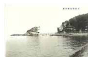
絵葉書にみる絵島