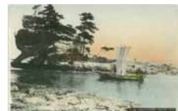
絵葉書にみる絵島

岩屋漁港にある小島で、国生み神話に登場する「おのころ島」伝承地の一つとされています。約 2 千万年前の砂岩層が露出し、岩肌の侵食模様が特徴となっています。