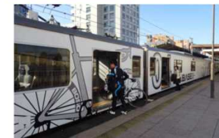
<サイクリング専用列車B.B.BASE>

鉄道事業者やバス事業者が実施するサイクルトレイン、サイクルバスの取組事例、方法等を集約し優良なものを選定した上で、ベストプラクティスの共有を行うとともに、自社路線におけるサイクルトレイン、サイクルバスの実施について検討を促す。