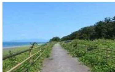
<太平洋岸自転車道>

太平洋岸自転車道等を対象として、先進的なサイクリング環境の整備を目指すモデルルートを設定し、関係者等で構成される協議会において、迷わず安全に走行できる環境整備、自転車のメンテナンスサービスの提供等サイクリストの受入環境整備、ガイドツアーの質の向上等滞在コンテンツの磨き上げ等による魅力づくり、ICTを活用した情報発信を行う等、官民が連携して世界に誇るサイクリングロードの整備を図る。