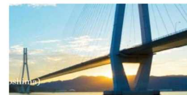
<しまなみ海道>

日本を代表し、世界に誇りうるサイクリングルートについて国内外へPRを図るため、ナショナルサイクルルート（仮称）の創設に向けて、インバウンドにも対応した走行環境や、サイクリングガイドの養成等受入れ先として備えるべき要件、情報発信の在り方等について検討する。