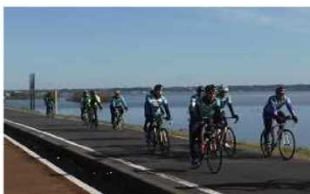
<つくば霞ヶ浦りんりんロード>

大規模自転車道を含めた、広域的なサイクリングロードの整備を推進する。その際、サイクリングロードの安全性や連続性を確保するため、農道や臨港道路を含む道路管理者及び河川管理者等からなる横断的協議機関の設置を促進するとともに、歩行者と自転車の交錯等の安全性に関する課題等について検討する。