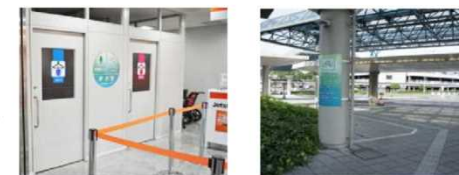
<空港内のサイクリスト受入施設>

道の駅のサイクリング拠点化や、鉄道駅や空港におけるサイクリストの受入サービスの充実に向けて、施設管理者等の関係者に対して協力を要請する。