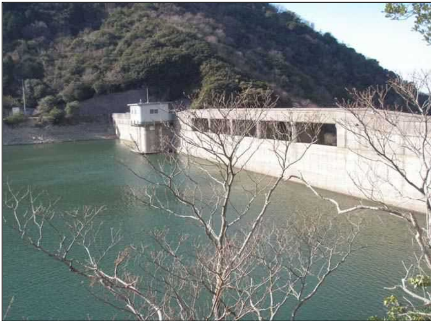
南-57 大日川ダム 上流より提体