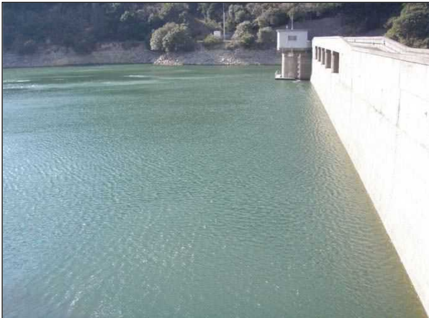
南-57 大田川ダム 提体前方