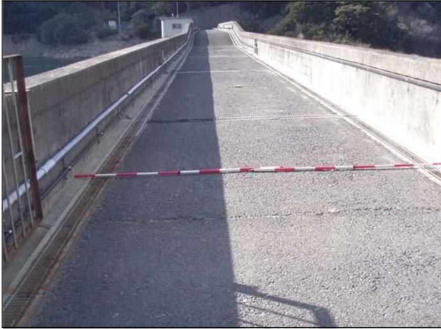
南-57 大日川ダム 提体 天端3.70m