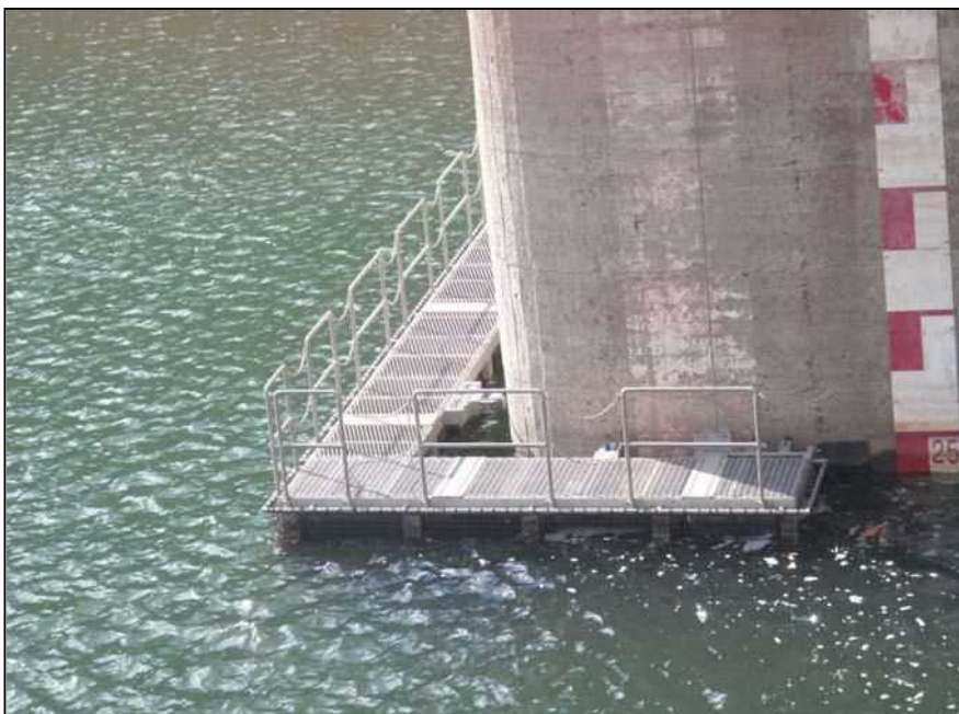
南-57 大日川ダム 取水施設