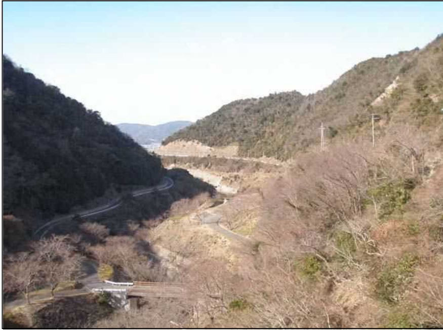
南-57 大日川ダム 提体より下流側