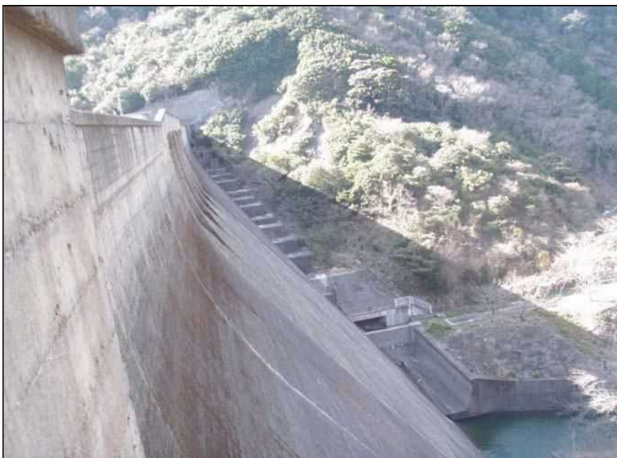
南-57 大田川ダム 提体後方