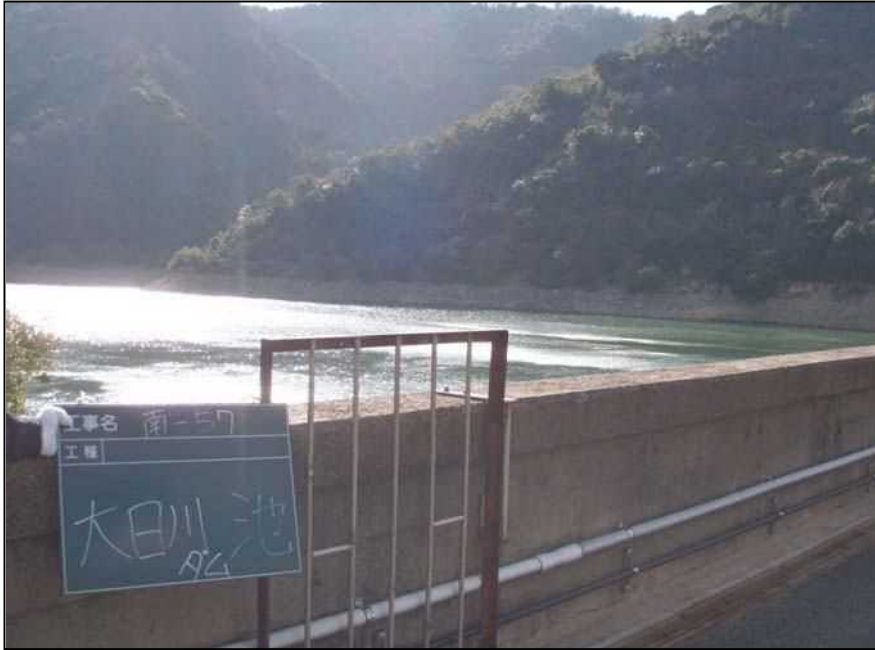
南-57 大田川ダム 全景