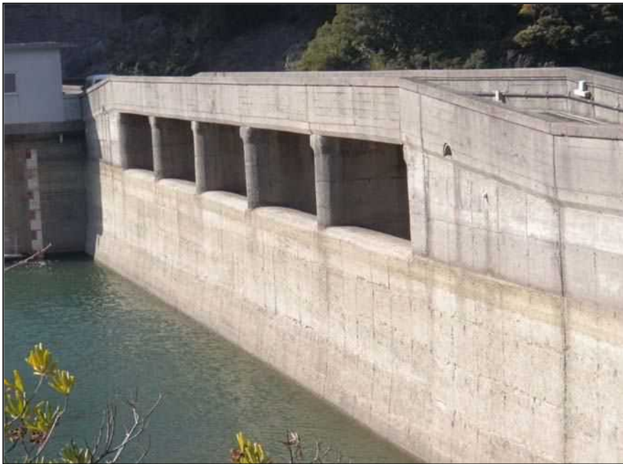
南-57 大日川ダム 洪水吐 W=38.00 H=2.00