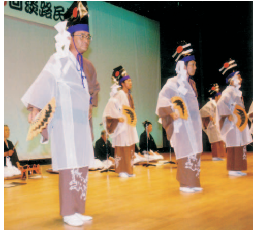
⑦ ちやうりんじ 長林寺 つかいだんじり (五色町)