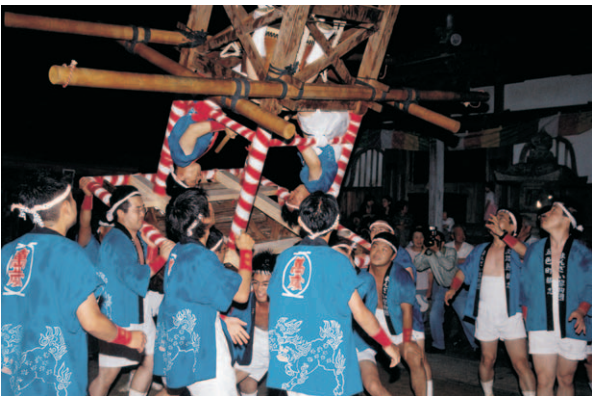
⑧ とりかい 鳥飼八幡神社 舟だんじり (五色町)