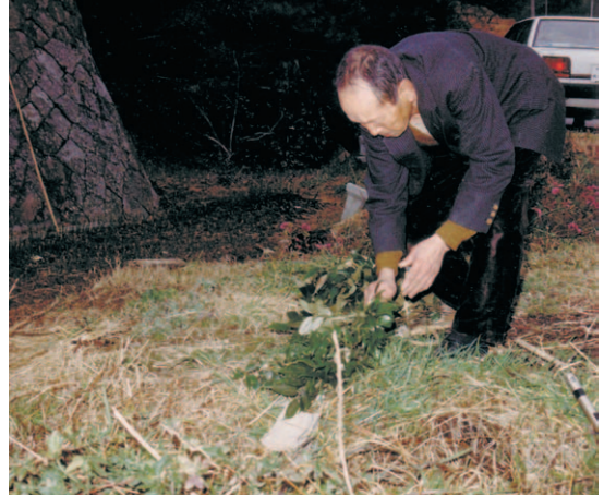
23 社日ツァン (北淡町仁井)