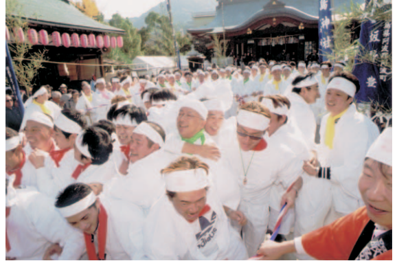
17 由良湊神社 ねり子祭り (洲本市)