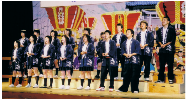
(志知高校郷土芸能部)