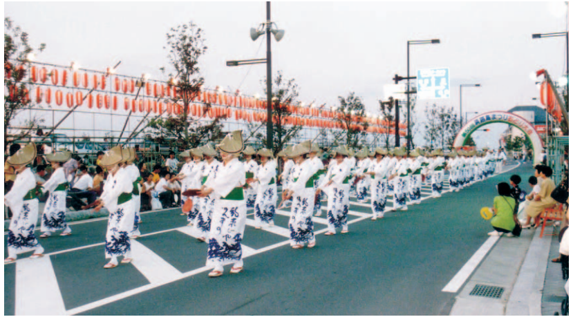
② 五尺踊 (緑町) P20 ⑦