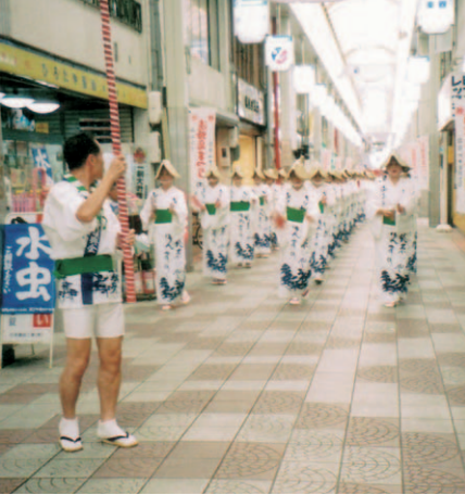
① 洲本民謡 おまあや (洲本市) P19 ②