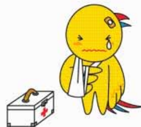
かかりつけ医について

また、かかりつけ医の支援体制の確保のため、地域医療連携室の設置や診療機能のオープン化などを推進する。